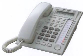
KX-T7730* 顯示型、免持聽筒對講話機